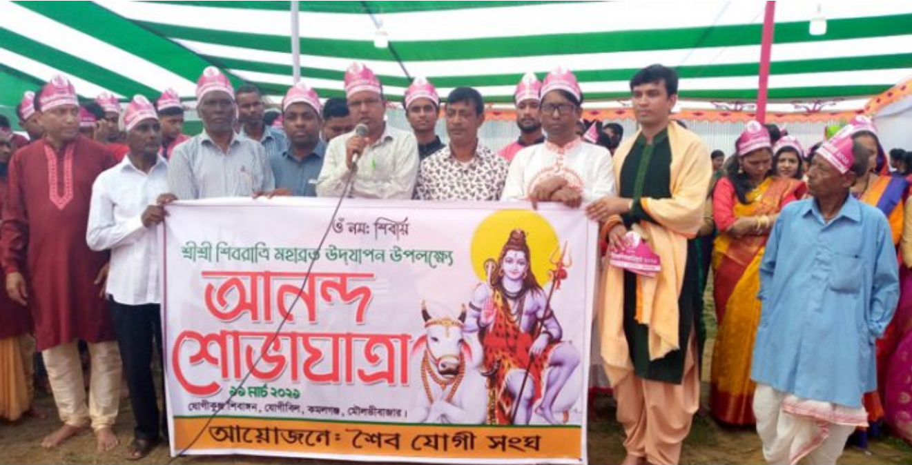
কমলগঞ্জ: মহা শিবরাত্রি উপলক্ষ্যে যোগীকিল শৈব যোগী সংঘের আয়োজনে বর্ণাঢ্য র্যালী।

শ্রীশ্রী শিবরাত্রি মহারত উদযাপন উপলক্ষ্যে আনন্দ শোভাযাত্রা ৩৯ মার্চ ২০২৩ যোগীসঙ্ঘ শিবসন, যোগীকিল, কমলগঞ্জ, মৌলভীবাজার। আয়োজনে: শৈব যোগী সংঘ